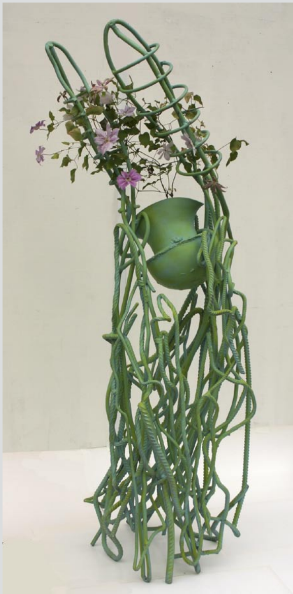
INSA WINKLER studio kunst und landschaft